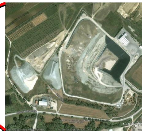
Discarica di Lanciano