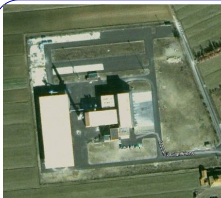
Inceneritore di Arezzo